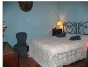
Vorzimmer des Bischofs

(Klicken Sie auf ein Bild, um es zu vergrößern)