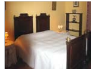
Zimmer des Bischofs