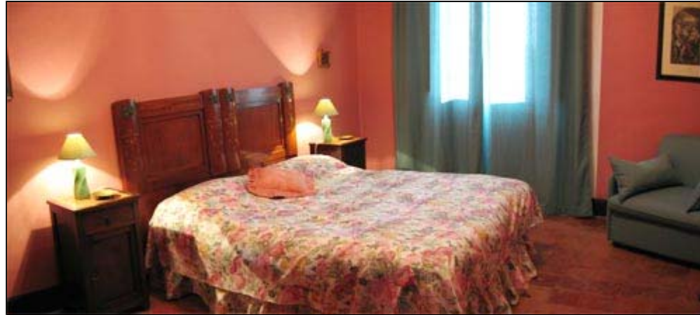
Das rosa Zimmer