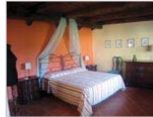
Zimmer der Einfassunger